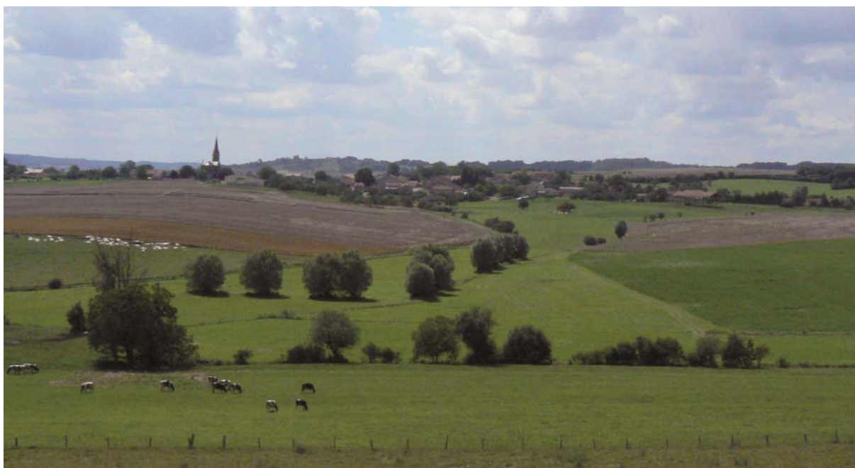
Campagne ouverte qu'affectionne la Chevêche

En France, elle est inscrite à la Liste rouge des oiseaux nicheurs dans la catégorie « préoccupation mineure ». C'est une espèce protégée en France (art. 3 de l'arrêté du 29 octobre 2009).